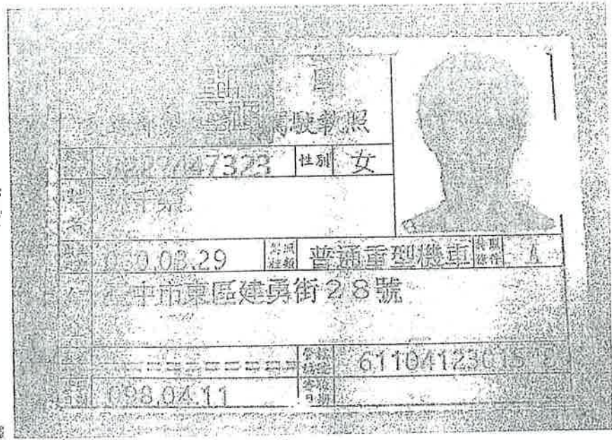
Image generated by the National Traffic Police Bureau of the Republic of China